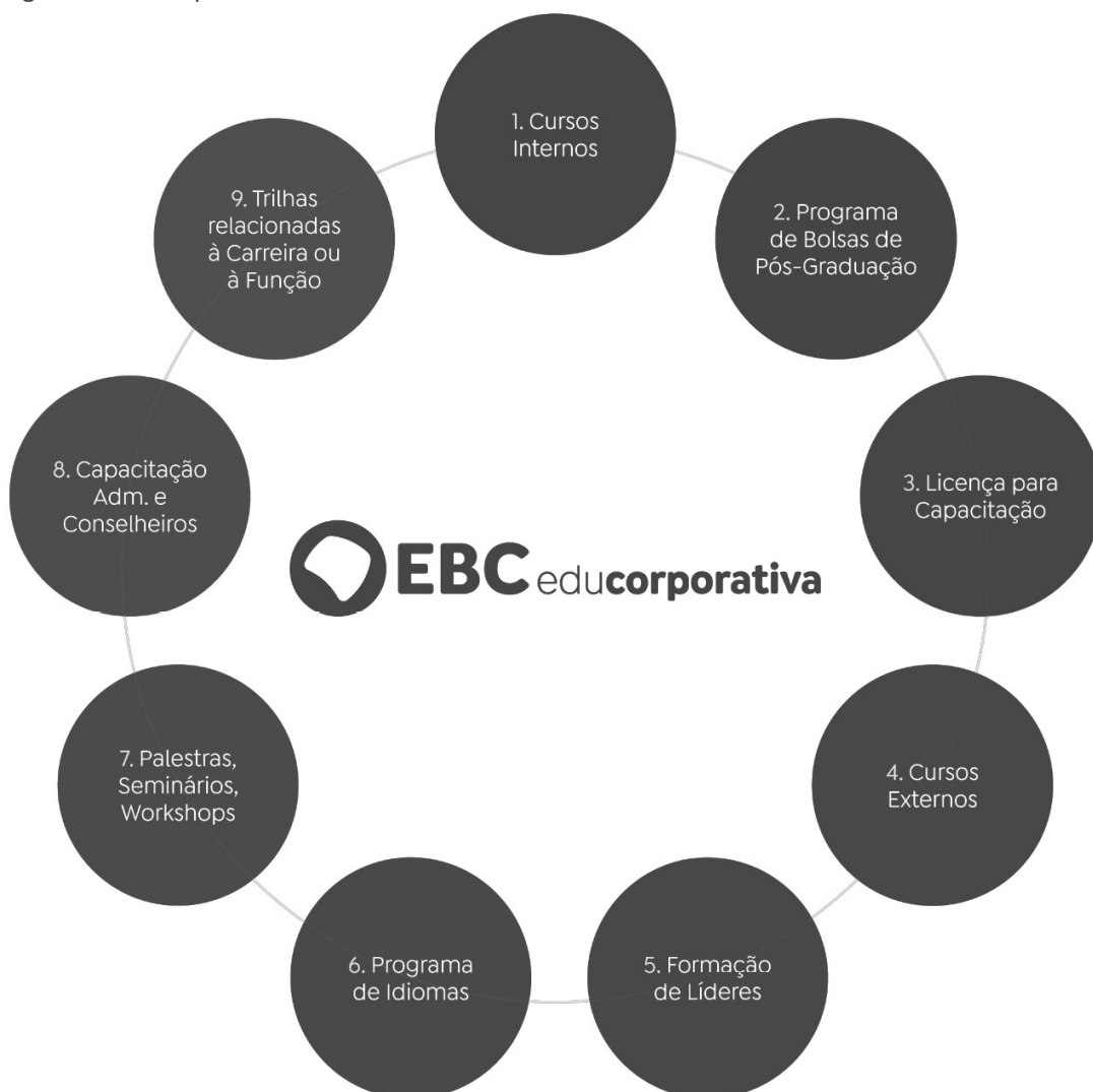
Figura 2 – Esquema de Capacitação da EBC

O esquema abaixo representa as oportunidades que estão disponíveis, por meio da Educação Corporativa da EBC para o treinamento, capacitação e aperfeiçoamento de empregados e gestores da Empresa.