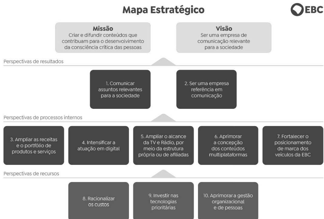
Figura 1 – Mapa Estratégico da EBC 2023-2027

Fonte: Planejamento Estratégico da EBC – revisado