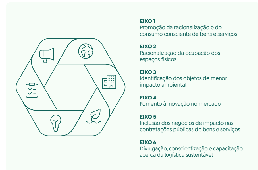
Figura 1. Eixos Temáticos PLS 2026-2028

Assim, o PLS abrange seis eixos temáticos , com objetivos, metas, ações, responsabilidades, prazos de execução e mecanismos de monitoramento e avaliação. Essa ferramenta de planejamento tem por finalidade aperfeiçoar continuamente a gestão da EBC, promovendo: ações estratégicas de contratação e parcerias; o uso responsável de recursos; a mitigação de impactos ambientais; o bem-estar de seus colaboradores, parceiros e da sociedade em geral e a valorização da cultura como um valor público fundamental.